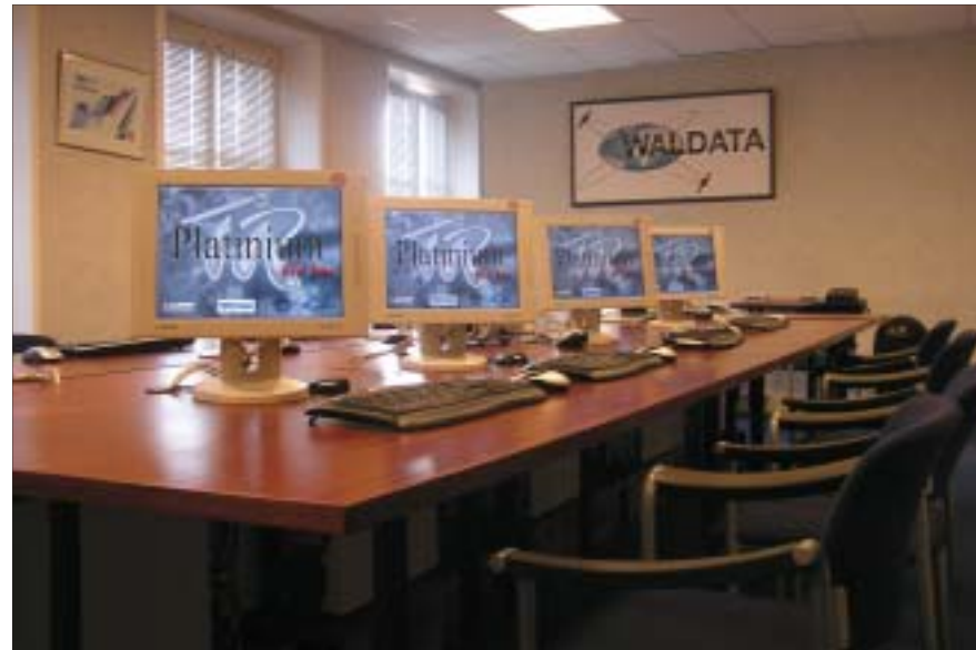
Un ordinateur par personne, 8 personnes maximum, Exercices pratiques avec rappels sur grand écran et support de cours

Calendrier à consulter sur notre site, waldata.fr. Réservation sur Internet ou sur le bon de commande ci-joint