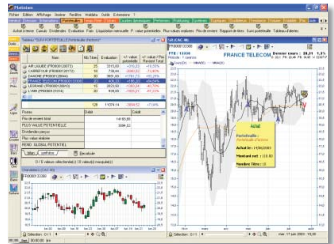
Vue d'ensemble de la nouvelle version 5. Vous remarquerez la gestion de portefeuille ainsi que le graphique qui affiche les achats / ventes détaillés effectués dans vos portefeuilles.

Si vous possédez un logiciel de la gamme Walmaster, vous avez déjà fait usage des tableaux dynamiques, outils indispensables à toute bonne gestion de vos listes de valeurs. Ces tableaux, déclencheurs d'alertes, fonctionnent par listes de valeurs, très pratiques pour trier et afficher un ensemble d'informations modifiables à l'aide de formules.